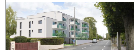
CONSTRUCTION D'UNE RESIDENCE SERVICE SENIORS